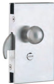
Cara exterior Posición R