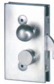
Cara interior Posición R